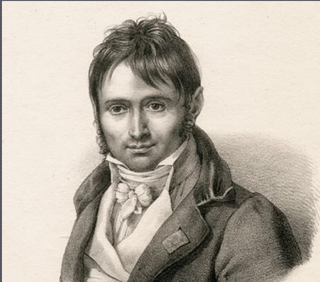
Joseph Exupere Bertin (1712 – 1781)